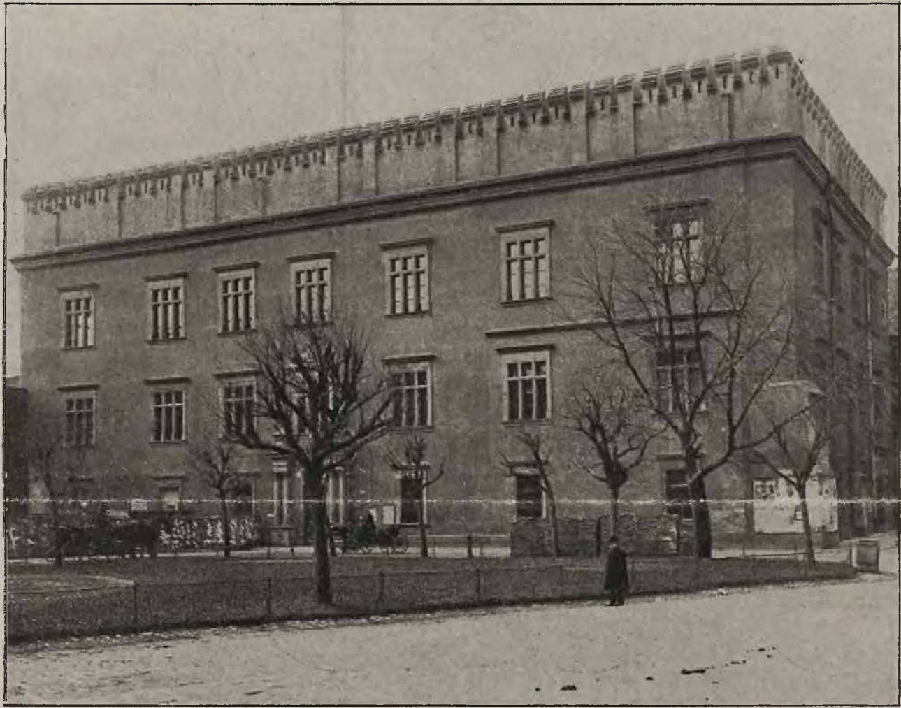
Gmach Magistratu (dawny pałac Wielopolskich).