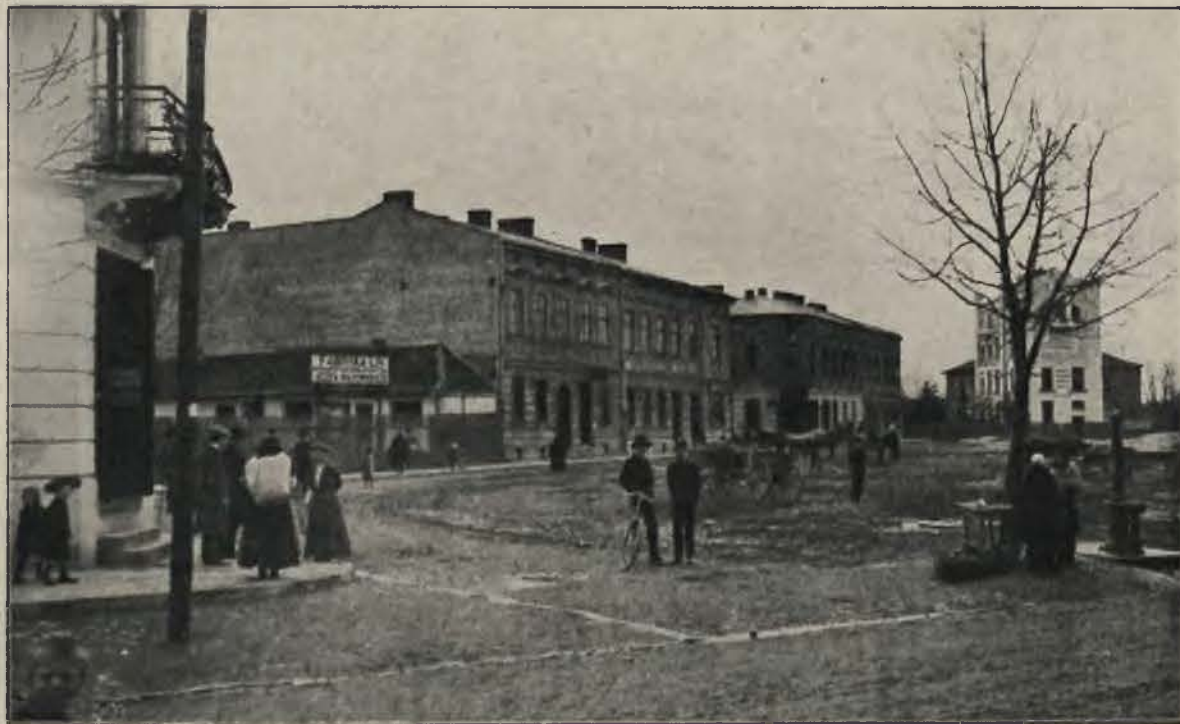
Rynek w Dębnykach.

Gdy 1 kwietnia 1866 miasto Kraków otrzymało własny statut, to równocześnie wypuściło ze swej opieki podległe sobie gminy: Czarną Wieś, Kawiorzy, Grzegórzki i Piaski oraz Dąbie, Beszcz i Głębniew. Gminy te na podstawie ustawy gminnej z r. 1866 organizować musiały dopiero utworzone rozporządzeniem Ministerstwa stanu z 23 stycznia 1867 Nr. 17